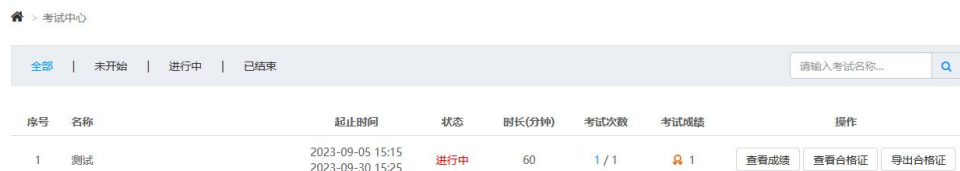
图 11 考试通过后的相关操作

考试通过后，进入考试中心，在“操作”栏下面出现“查看成绩”、“查到合格证书”和“导出合格证书”三项操作，导出合格证书为 PDF 版本。