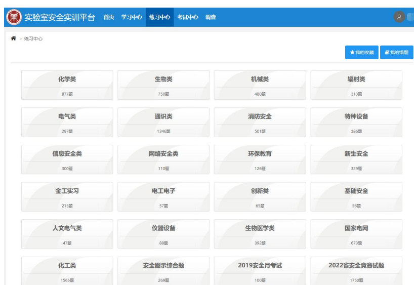
图 3 练习中心界面

在平台顶部菜单栏点击“练习中心”，如图 3 所示，不同专业的师生可根据自身情况选择不同的模块进行专题练习，每个模块分为顺序练习和随机练习，如图 4 所示。