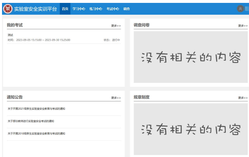
图 2 平台首页