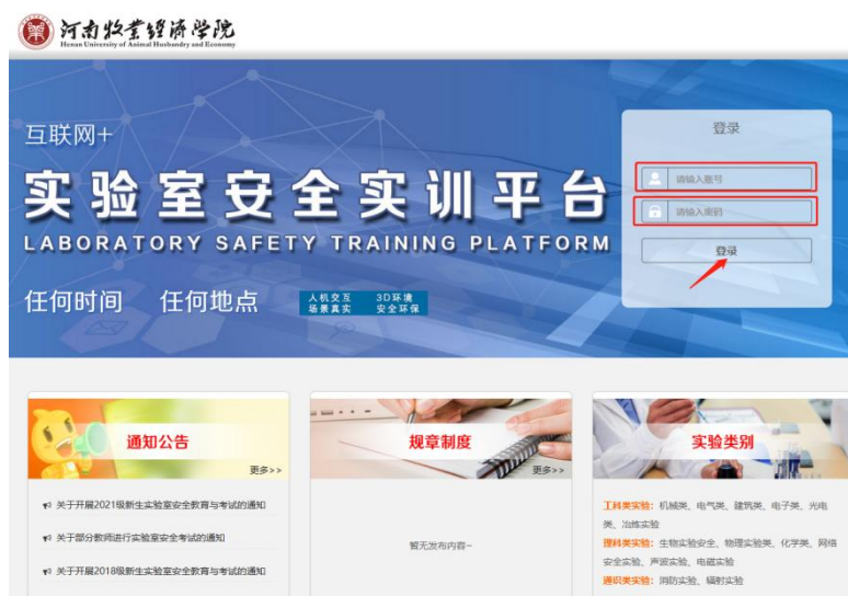
图1 电脑端登录界面

在欢迎界面分别输入账号和密码点击【登录】进入平台（教师登录账号为工号，学生登录账号为学号，初始密码均为111111）。