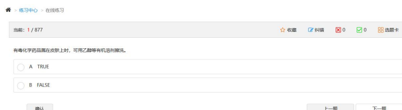
图 4 专题练习