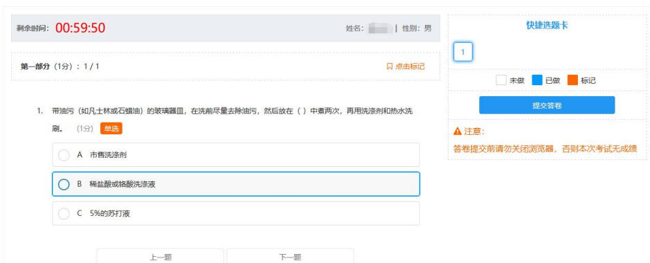
图 7 考试答题界面（仅为测试用例，非正式考试）