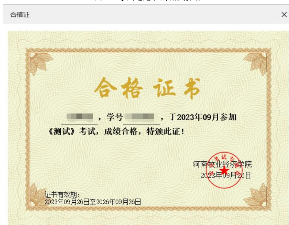
图 12 查看合格证书