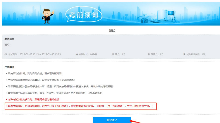
图 6 考前须知界面