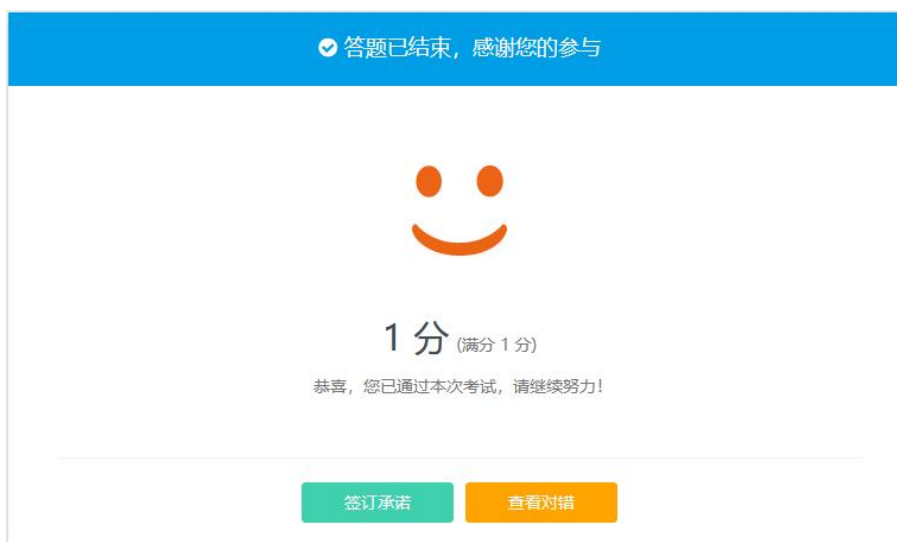
图 9 考试结束界面