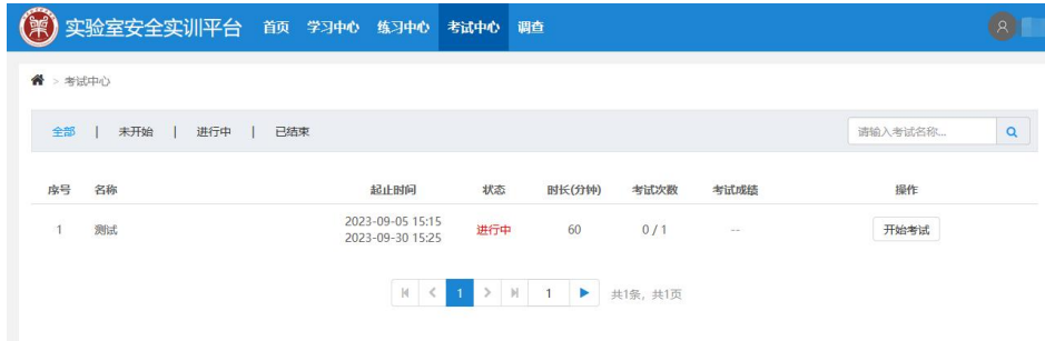
图 5 考试中心界面

在平台顶部菜单栏点击“考试中心”，如图 5 所示，即可看到当前进行的考试，点击“开始考试”可链接到考前须知界面（如网页有拦截，请取消该拦截），如图 6 所示，请注意“如果考试通过，且对成绩满意，则考生必须【签订承诺】，否则影响证书的发放。（注意：一旦“签订承诺”，考生不能再进行考试。）”。